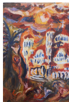
Ιερός Ναός Παναγίας Παλουριώτισσας